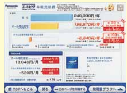
簡単な質問に答えるだけで驚きの結果に。