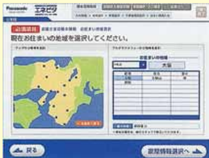
現在のお住まいの地域を選択して下さい。

太陽光発電やエコキュート+IHを導入すると光熱費がどのくらい削減できるか試算します。