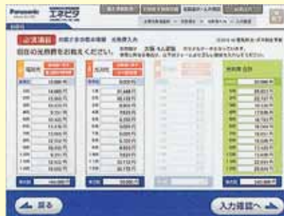
現在のおうちの光熱費を教えてください。